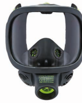
Vollmasken BLS 3000