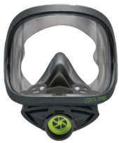
Vollmasken BLS 2150 - BLS 2150V