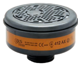
Filter BLS 400 Serie