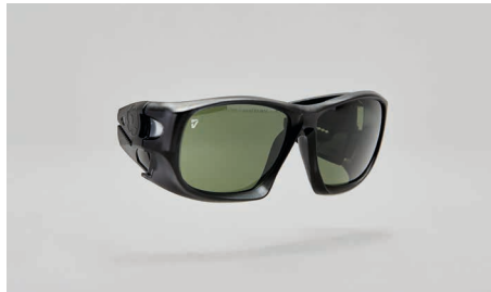
C22 – Rahmen für Korrekturgläser.