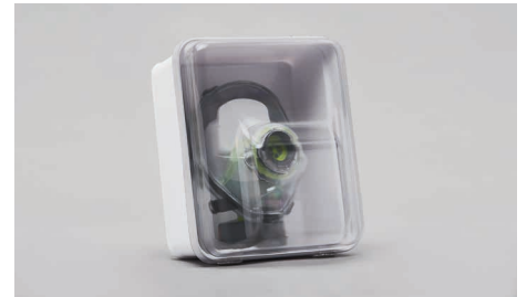
C90 – Wandbefestigter Container.