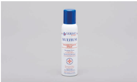
Q409 – Desinfektionsspray 150ml.