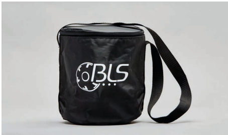
C43 – Waschbare Tasche mit Schultergurt.