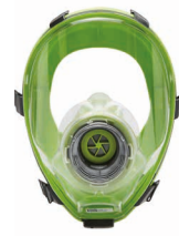
Vollmasken BLS 5400 - BLS 5150