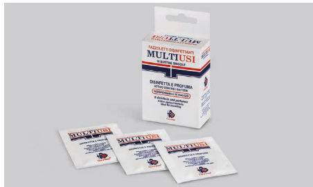
Q530 – Desinfektionstücher